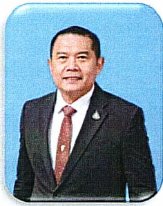
สารอธิบดี