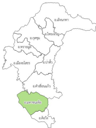
จังหวัดยโสธร

“สำนักงานเกษตรอำเภอมหาชนะชัย จังหวัดยโสธร”