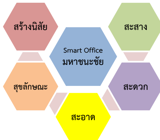
กระบวนการ ๕ส ของสำนักงานเกษตรอำเภอมหาชนะชัย

สำนักงานเกษตรอำเภอมหาชนะชัย จังหวัดยโสธร ได้มีการขับเคลื่อนการดำเนินงานสำนักงานเกษตรอำเภอ Smart Office ตามนโยบายกรมส่งเสริมการเกษตร โดยได้มีการประชุมเจ้าหน้าที่เพื่อรับทราบนโยบายและร่วมกันแสดงความคิดเห็นเพื่อกำหนดเป็นแผนการดำเนินงาน โดยเริ่มจากการใช้กระบวนการ ๕ส เพื่อพัฒนาให้สำนักงานมีความน่าอยู่และสนับสนุนกระบวนการทำงานให้แก่เจ้าหน้าที่และผู้มาใช้บริการ