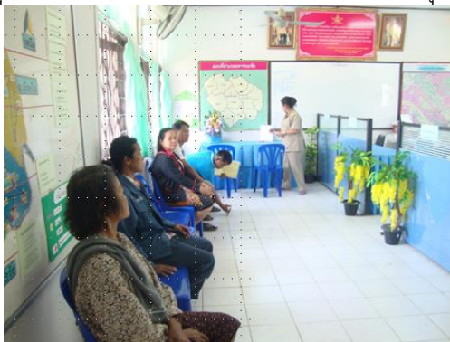
จุดที่ ๒ รอรับบริการ

จุดที่ ๑ รับบัตรคิว/แยกรอรับบริการ และ จุดที่ ๔ ประเมินความพึงพอใจผู้ใช้บริการ จะเป็นจุดเดียวกัน