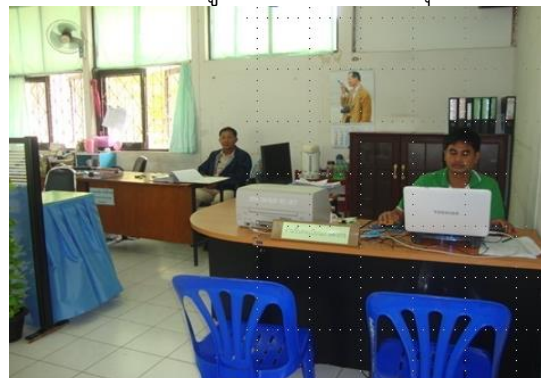
จุดที่ ๓ จุดให้บริการ