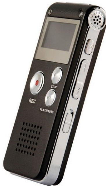
เครื่องบันทึกเสียง