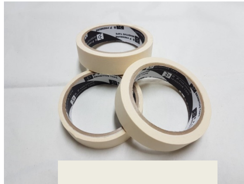
กระดาษกาว