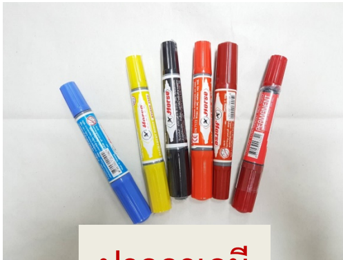
ปากกาเคมี