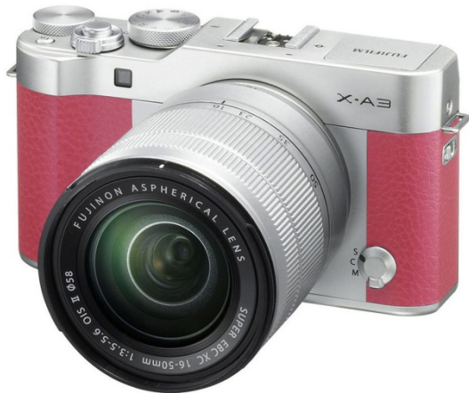
กล้องถ่ายรูป