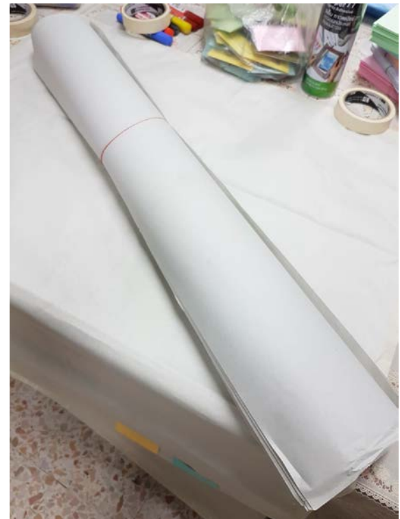
กระดาษฟาง