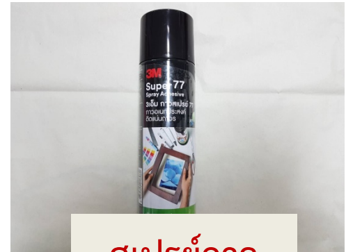
สเปรย์กาว