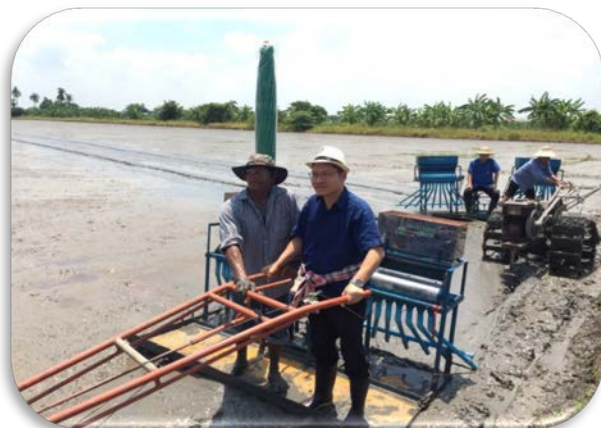
เครื่องหยอดเมล็ดพันธุ์ข้าว