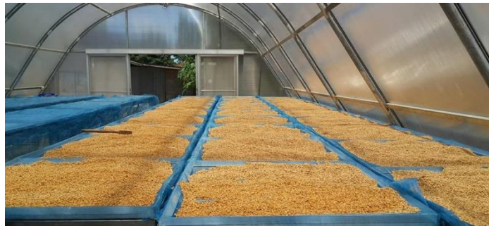
ผึ่งลมหรือตากแดดให้ข้าวเปลือกที่นึ่งแล้วแห้ง