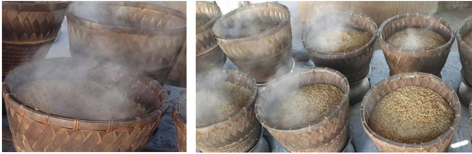
ขั้นตอนการนึ่งข้าว